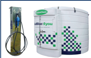
Tanks und Zapfsäulen