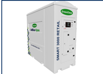
SMART 3000 Retail