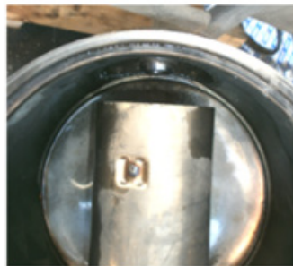
Die Verwendung von Effinox verhindert die Kristallbildung und hält das SCR-System am Laufen.