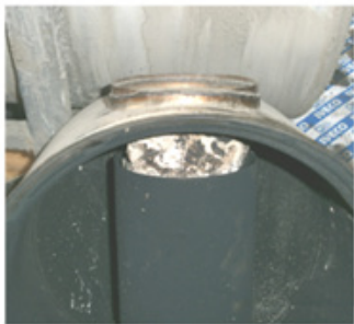
Weißer, kristallartige Harnstoffablagerungen verstopfen den Auspuff.