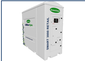
SMART 3000 Retail