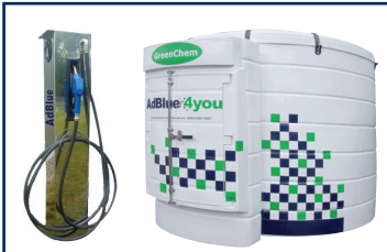
Tanks und Zapfsäulen