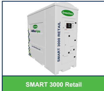
SMART 3000 Retail