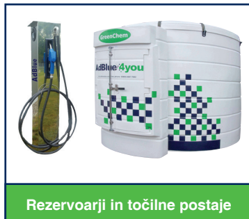
Rezervoarji in točilne postaje