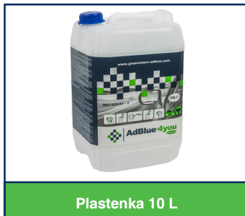
Plastenka 10 L