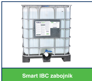
Smart IBC zabojnik