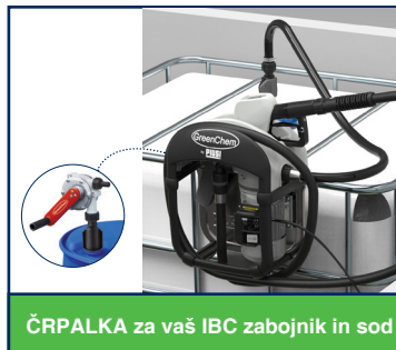
ČRPALKA za vaš IBC zabojnik in sod