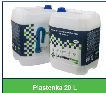
Plastenka 20 L