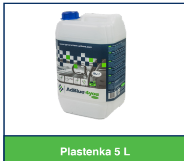
Plastenka 5 L