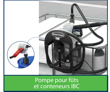
Pompe pour fûts et conteneurs IBC