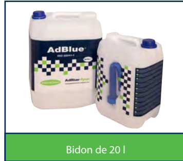
Bidon de 20 l