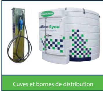
Cuves et bornes de distribution