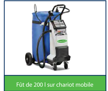
Fût de 200 l sur chariot mobile