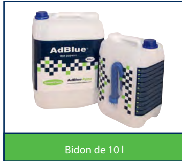
Bidon de 10 l