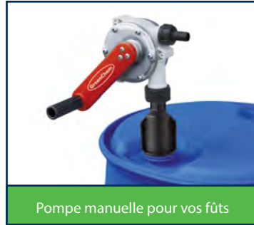
Pompe manuelle pour vos fûts