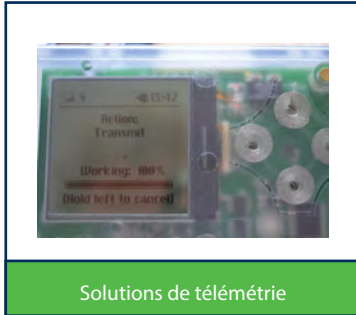
Solutions de télémétrie