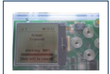
Solutions de télémétrie