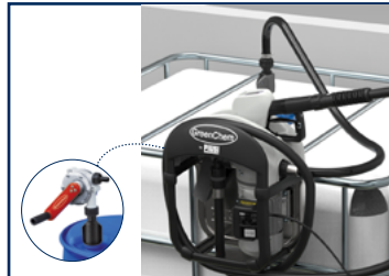
Pompe pour fûts et conteneurs IBC