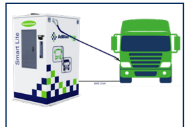
Solutions de distribution SMART