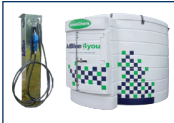
Réservoirs et poste de distribution