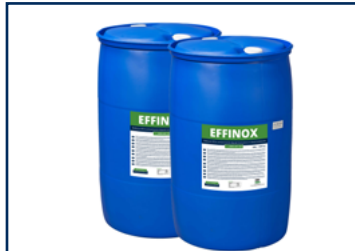
EFFINOX Drum 200L