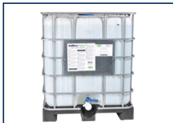
AdBlue IBC 1000L