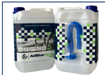
Bidon de 5-10-20L