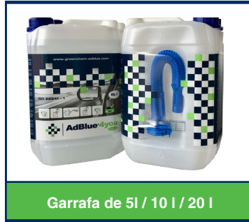
Garrafa de 5l / 10 l / 20 l