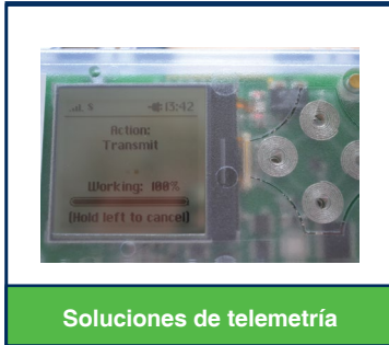
Soluciones de telemetría