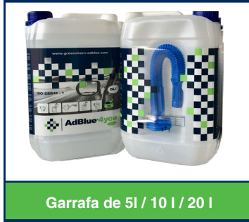
Garrafa de 5l / 10 l / 20 l