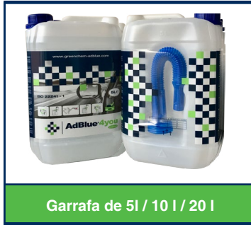
Garrafa de 5l / 10 l / 20 l