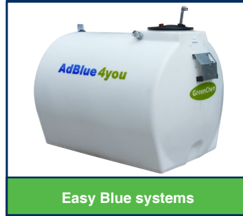
Easy Blue systems