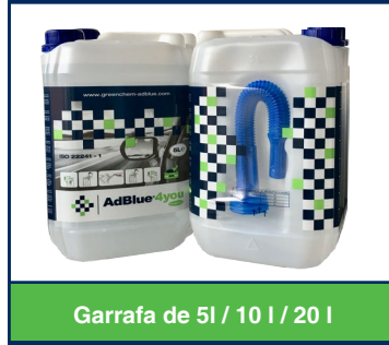
Garrafa de 5l / 10 l / 20 l