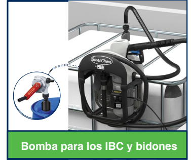
Bomba para los IBC y bidones