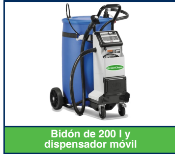
Bidón de 200 l y dispensador móvil