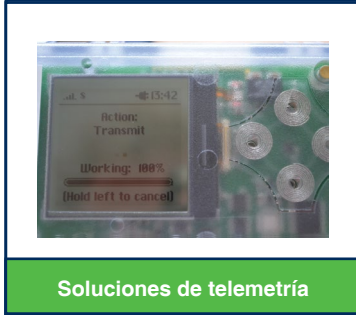
Soluciones de telemetría