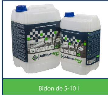
Bidon de 5-10 l