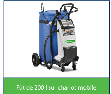
Fût de 200 l sur chariot mobile