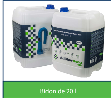
Bidon de 20 l