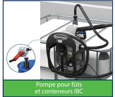
Pompe pour fûts et conteneurs IBC