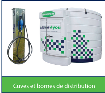
Cuves et bornes de distribution