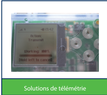
Solutions de télémétrie