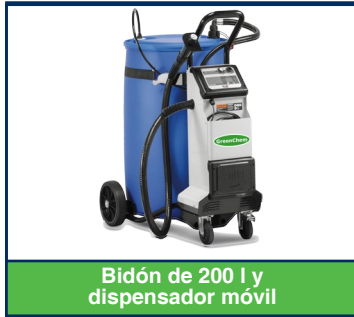
Bidón de 200 l y dispensador móvil