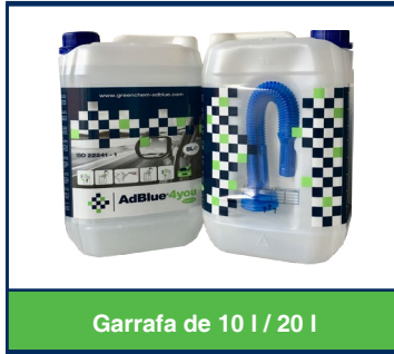
Garrafa de 10 l / 20 l