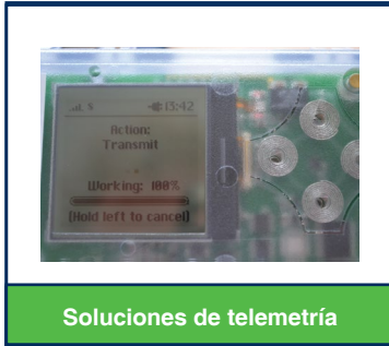
Soluciones de telemetría