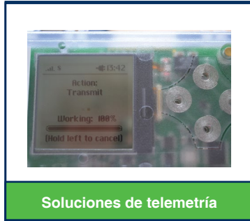
Soluciones de telemetría