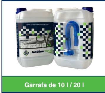
Garrafa de 10 l / 20 l