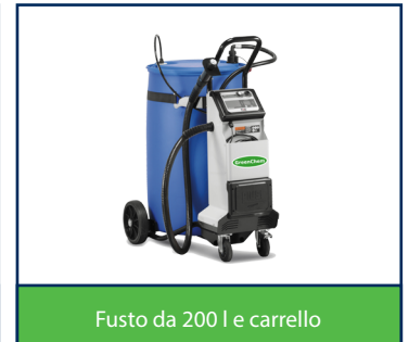
Fusto da 200 l e carrello