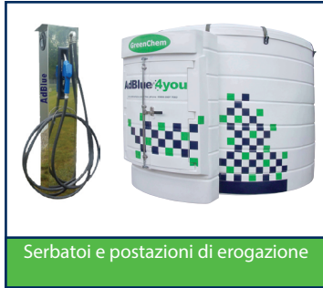
Serbatoi e postazioni di erogazione