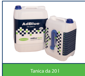
Tanica da 20 l