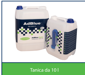
Tanica da 10 l