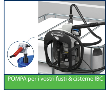
POMPA per i vostri fusti & cisterne IBC