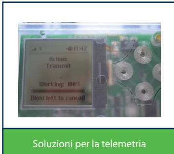
Soluzioni per la telemetria