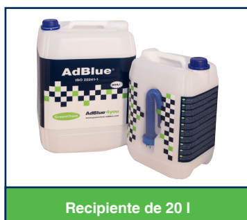
Recipiente de 20 l