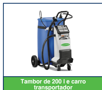
Tambor de 200 l e carro transportador