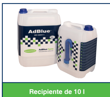
Recipiente de 10 l