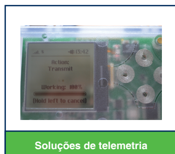
Soluções de telemetria