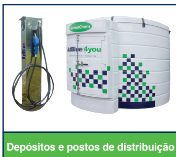
Depósitos e postos de distribuição