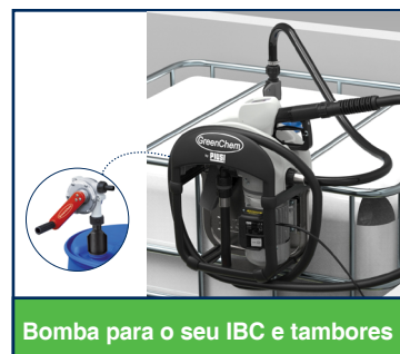
Bomba para o seu IBC e tambores