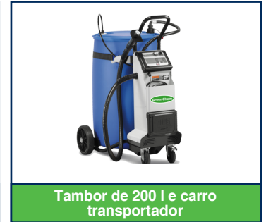
Tambor de 200 l e carro transportador