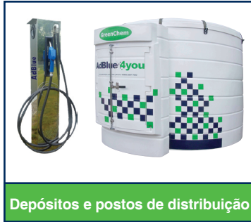
Depósitos e postos de distribuição