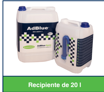
Recipiente de 20 l