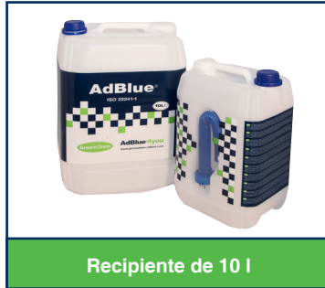
Recipiente de 10 l