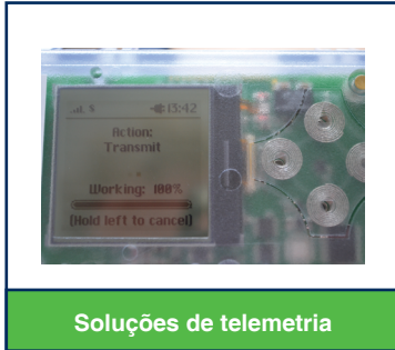
Soluções de telemetria