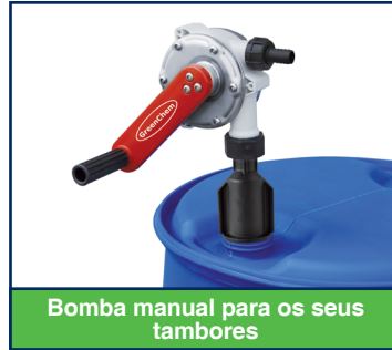
Bomba manual para os seus tambores