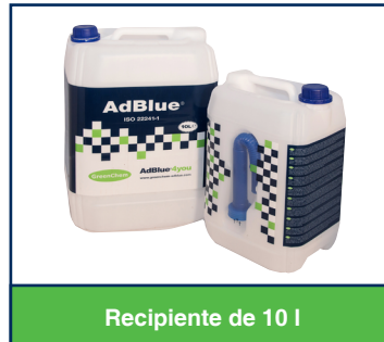
Recipiente de 10 l