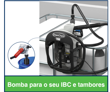
Bomba para o seu IBC e tambores