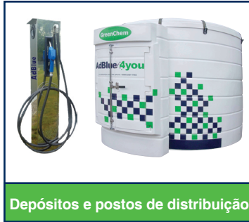
Depósitos e postos de distribuição