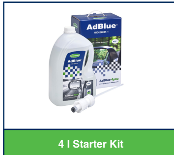
4 l Starter Kit