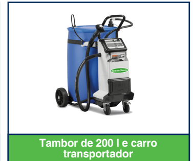
Tambor de 200 l e carro transportador