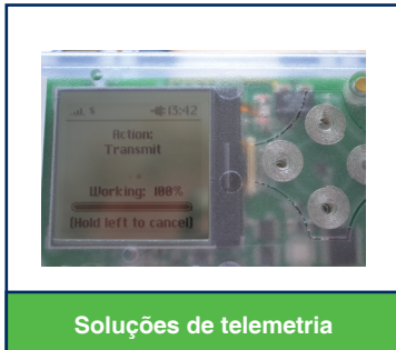
Soluções de telemetria