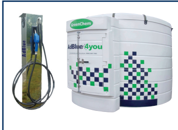
Depósitos e postos de distribuição