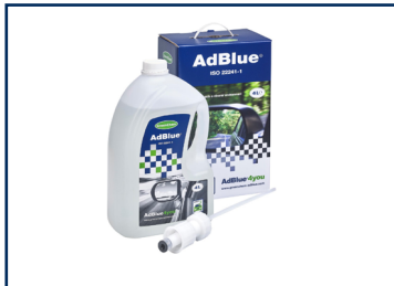
4 l Starter Kit