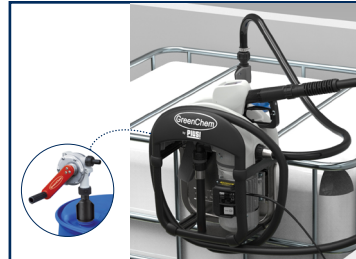
Bomba para o seu IBC e tambores