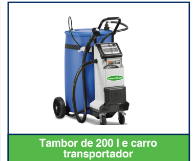
Tambor de 200 l e carro transportador