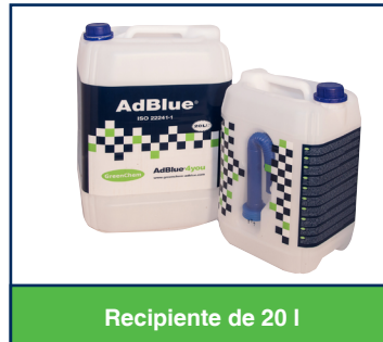
Recipiente de 20 l