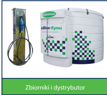
Zbiorniki i dystrybutor