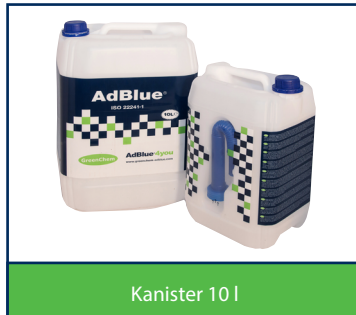
Kanister 10 l