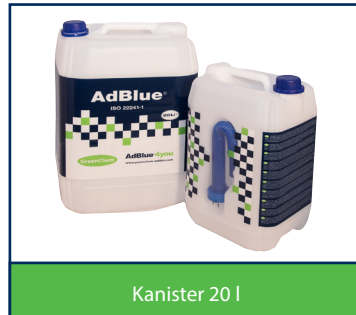
Kanister 20 l