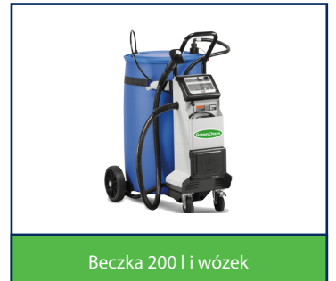
Beczka 200 l i wózek