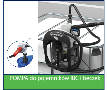
POMPA do pojemników IBC i beczek