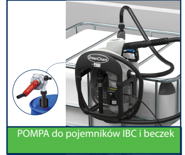
POMPA do pojemników IBC i beczek