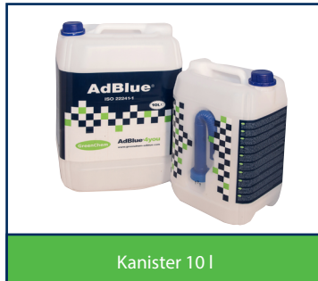
Kanister 10 l