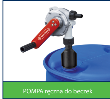
POMPA ręczna do beczek