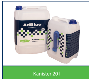
Kanister 20 l