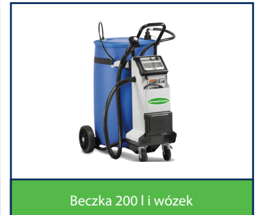
Beczka 200 l i wózek