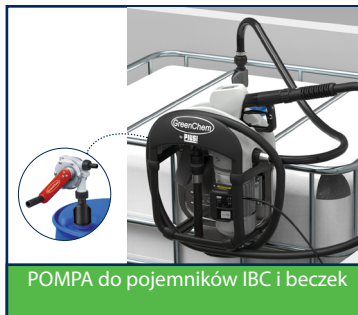
POMPA do pojemników IBC i beczek