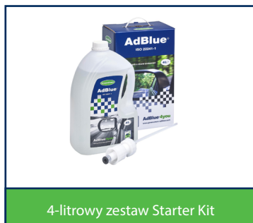
4-litrowy zestaw Starter Kit