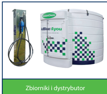
Zbiorniki i dystrybutor