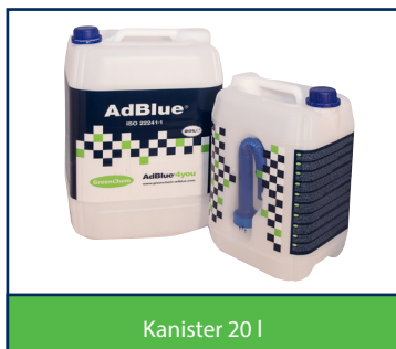
Kanister 20 l