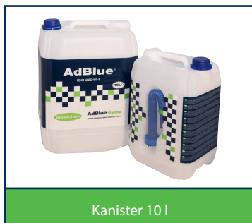
Kanister 10 l