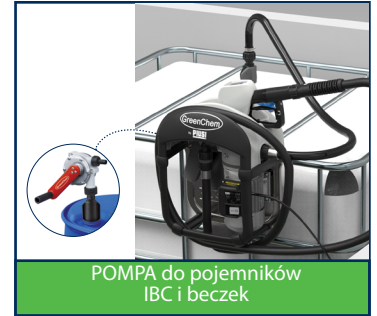
POMPA do pojemników IBC i beczek