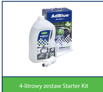
4-litrowy zestaw Starter Kit