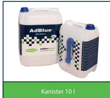
Kanister 10 l