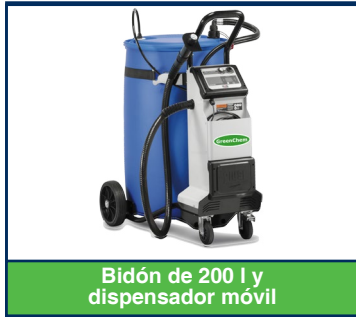
Bidón de 200 l y dispensador móvil