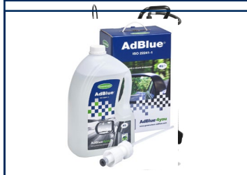
Starter Kit de 4 litros