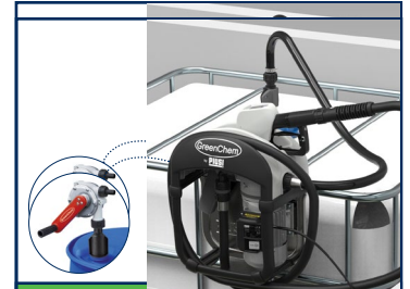
Bomba para los IBC y bidones