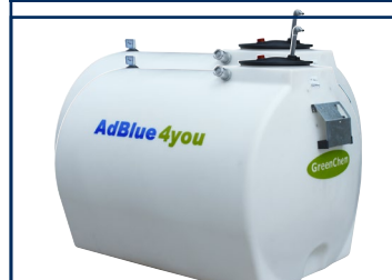
Easy Blue systems