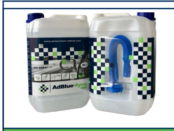
Garrafa de 10 / 20 l