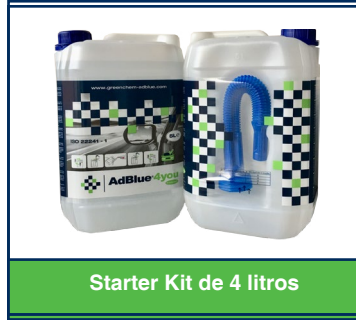
Starter Kit de 4 litros