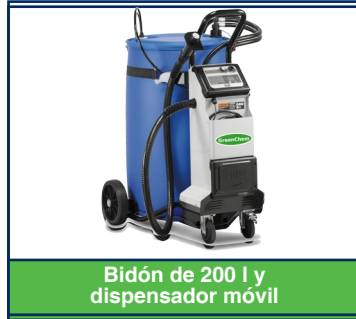
Bidón de 200 l y dispensador móvil