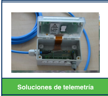
Soluciones de telemetría