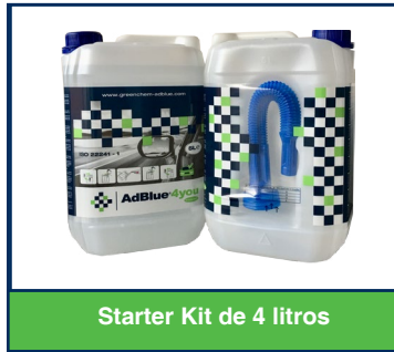
Starter Kit de 4 litros