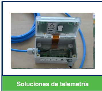
Soluciones de telemetría