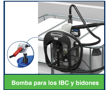
Bomba para los IBC y bidones