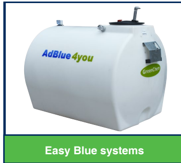
Easy Blue systems