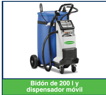
Bidón de 200 l y dispensador móvil