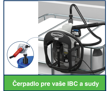
Čerpadlo pre vaše IBC a sudy