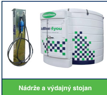
Nádrže a výtlačný stojan