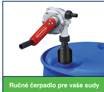
Ručné čerpadlo pre vaše sudy