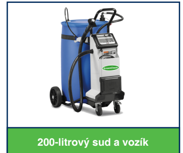
200-litrový sud a vozík