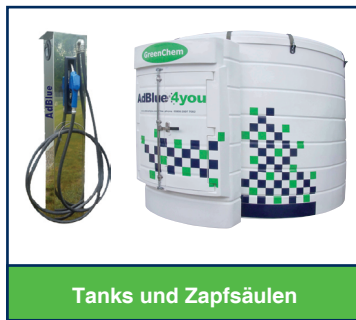
Tanks und Zapfsäulen