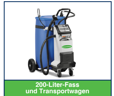
200-Liter-Fass und Transportwagen

Belgien | Brasilien | Frankreich | Irland | Italien | Niederlande | Polen | Portugal | Slowakei | Spanien | Tschechische Republik | Ungarn | Vereinigtes Königreich