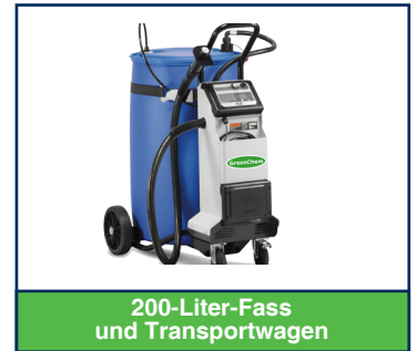
200-Liter-Fass und Transportwagen