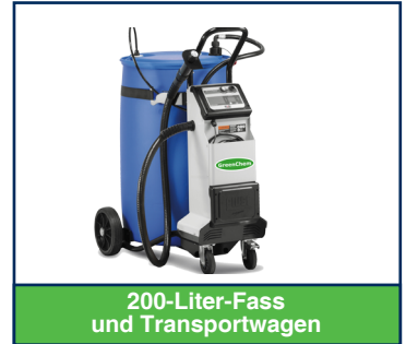
200-Liter-Fass und Transportwagen