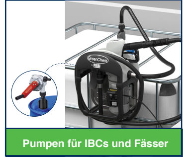
Pumpen für IBCs und Fässer