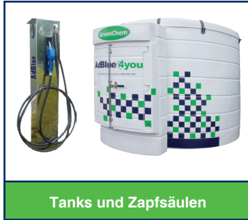
Tanks und Zapfsäulen