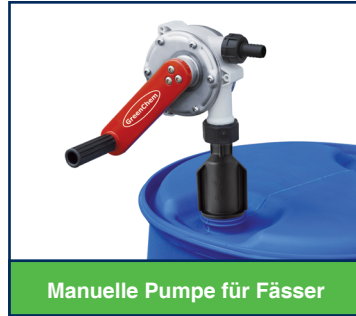
Manuelle Pumpe für Fässer