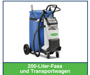
200-Liter-Fass und Transportwagen