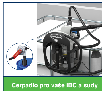
Čerpadlo pro vaše IBC a sudy