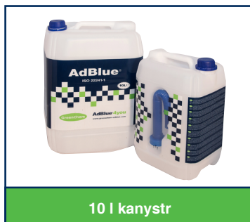
10 l kanystr