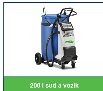
200 l sud a vozík