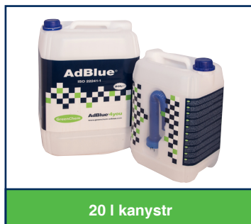
20 l kanystr