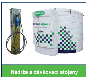
Nádrže a dávkovací stojany