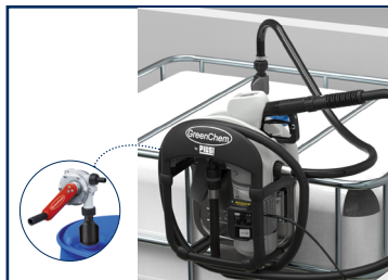
Čerpadlo pro vaše IBC a sudy