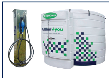
Nádrže a dávkovací stojany