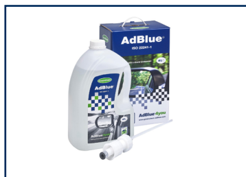
4 l Starter Kit