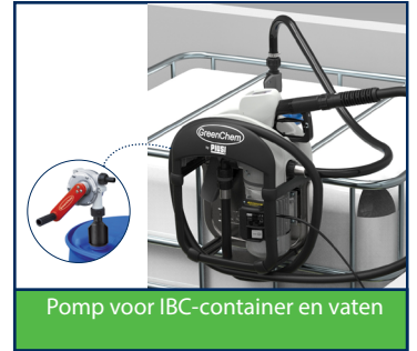
Pomp voor IBC-container en vaten