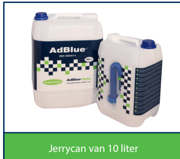
Jerrycan van 10 liter