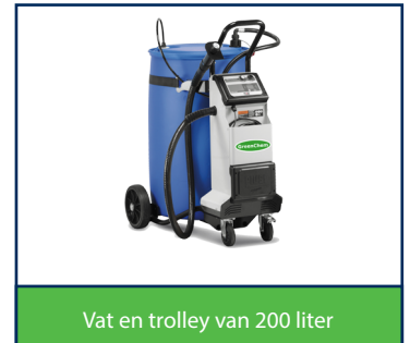
Vat en trolley van 200 liter