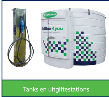
Tanks en uitgiftestations