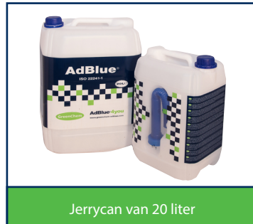
Jerrycan van 20 liter