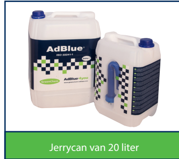
Jerrycan van 20 liter