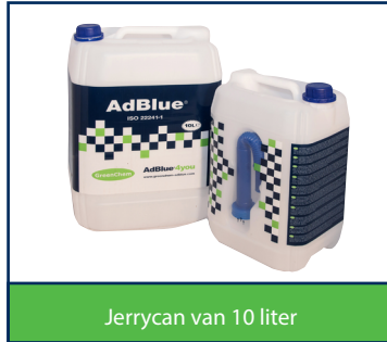
Jerrycan van 10 liter