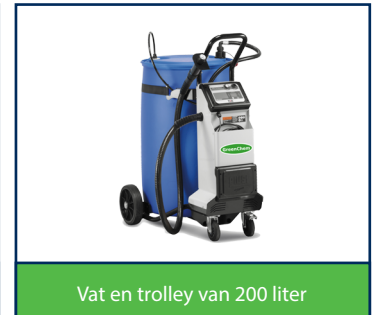
Vat en trolley van 200 liter