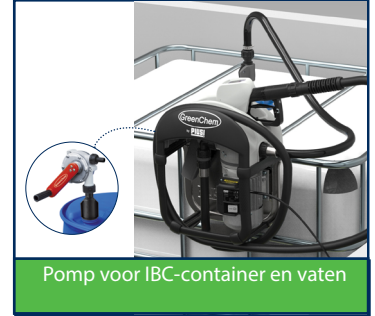
Pomp voor IBC-container en vaten