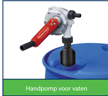
Handpomp voor vaten