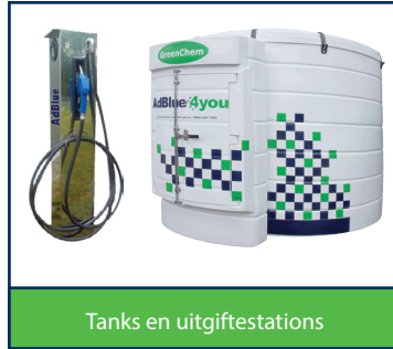
Tanks en uitgiftestations