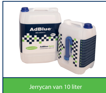
Jerrycan van 10 liter