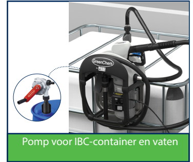
Pomp voor IBC-container en vaten