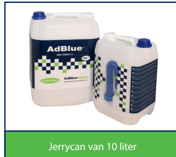
Jerrycan van 10 liter