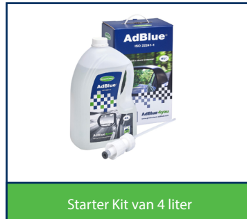
Starter Kit van 4 liter