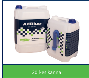
20 l-es kanna