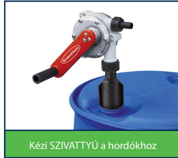
Kézi SZIVATTYÚ a hordókhöz