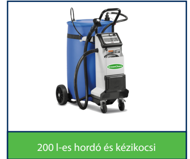
200 l-es hordó és kézikocsi