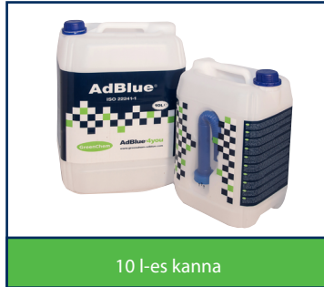
10 l-es kanna