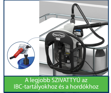
A legjobb SZIVATTYÚ az IBC-tartályokhoz és a hordókhöz