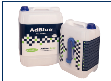
20 l-es kanna