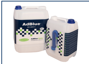
10 l-es kanna