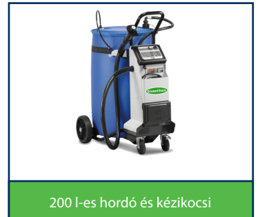
200 l-es hordó és kézikocsi