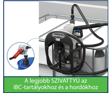
A legjobb SZIVATTYÚ az IBC-tartályokhoz és a hordókhöz