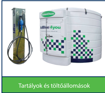
Tartályok és töltőállomások