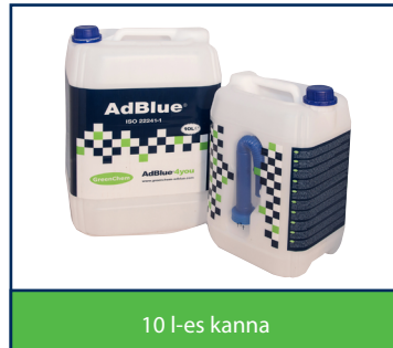
10 l-es kanna