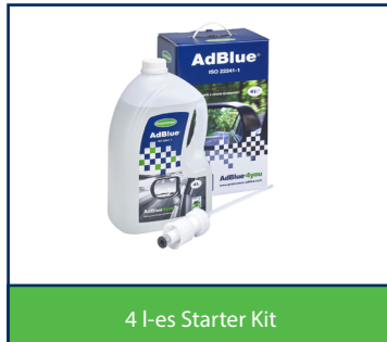
4 l-es Starter Kit