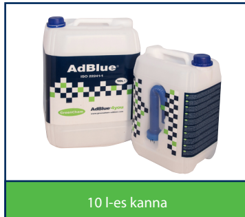
10 l-es kanna