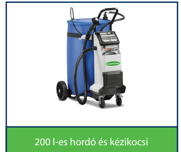
200 l-es hordó és kézikocsi