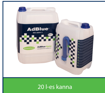
20 l-es kanna