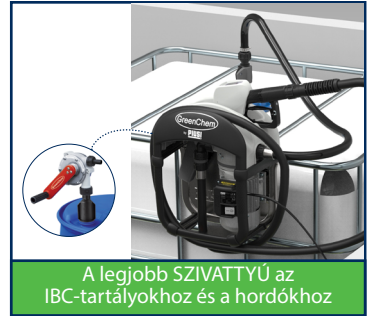
A legjobb SZIVATTYÚ az IBC-tartályokhoz és a hordókhoz